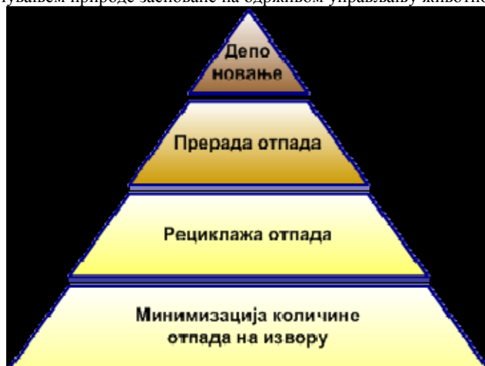
Слика 1.1.1. Циљеви управљања отпадом

Дугорочни циљ израде Локалног плана управљања отпадом је решавање проблема у области заштите животне средине и побољшање квалитета живота становништва осигуравањем жељених услова животне средине и очувањем природе засноване на одрживом управљању животном средином.